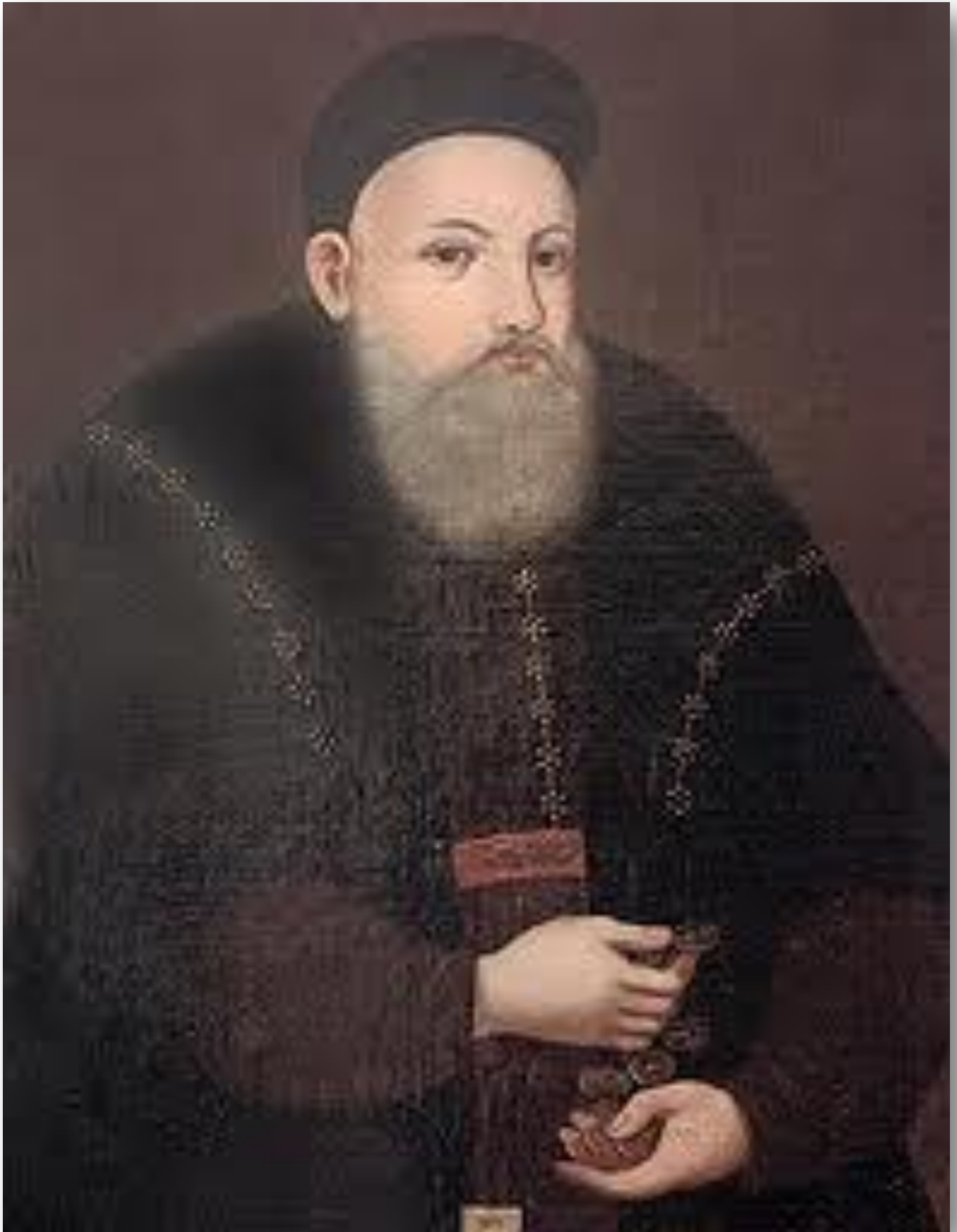
Князь К.-В. Острозький (1526—1608)