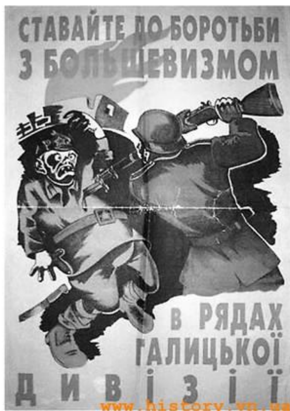
Плакат із закликом вступати в дивізію СС «Галичина»

1) Я вбачаю розв'язання українського питання, так само як і польського, в тому, що вони будуть у нашому розпорядженні як робоча сила... але щодо дистрикту «Галичина» слід зазначити, що тут йдеться про складову частину великого Німецького рейху, а не про якусь там Велику Україну навіть тільки в духовному розумінні.